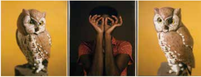
Izquierda: María Magdalena Campos-Pons (nacida en 1959), cubana. Anidando, 2007. 3 impresiones Polaroid (edición de 3), 24 x 60 pulgadas.