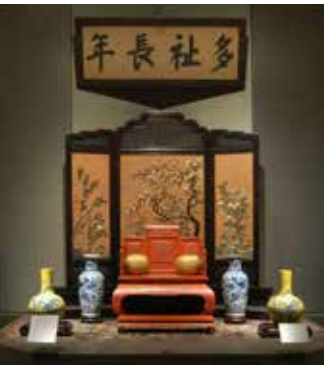
Dinastía Qing (1644–1912) muestra de un trono, incluyendo arte cortesano de China en la Galería de Betty y John Soreng